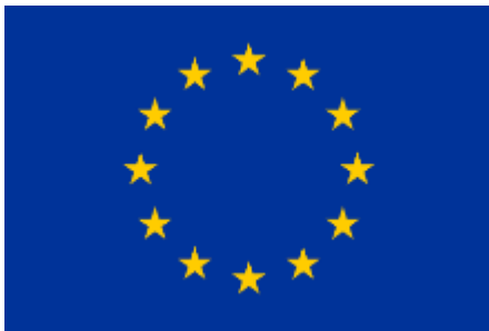
De Europese vlag is in 1985 door de Europese Economische Gemeenschap aangenomen.

De zes landen bleken zo goed samen te werken dat ze besloten verder te gaan en de Europese Economische Gemeenschap (EEG) op te richten. "Economisch" heeft te maken met geld, bedrijven, banen en handel.