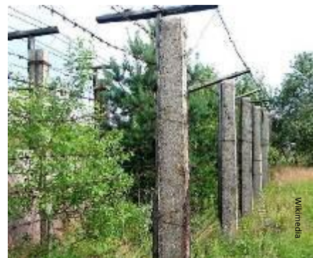
Overblijfselen van het IJzeren Gordijn in voormalig Tsjecho-Slowakije.

De landen die hun vrijheid hadden herwonnen, hervormden hun wetten en economieën en werden lid van de EU. De EU bestaat nu uit 28 landen (zie blz. 6).