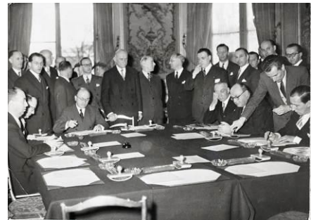
Het Verdrag van de Europese Gemeenschap voor Kolen en Staal werd in 1951 in Parijs ondertekend.

Daarom zijn zes Europese landen (België, Frankrijk, Duitsland, Italië, Luxemburg en Nederland) overeengekomen hun kolen- en staalindustrie samen te voegen. Ze hebben de "Europese Gemeenschap voor Kolen en Staal" opgericht.