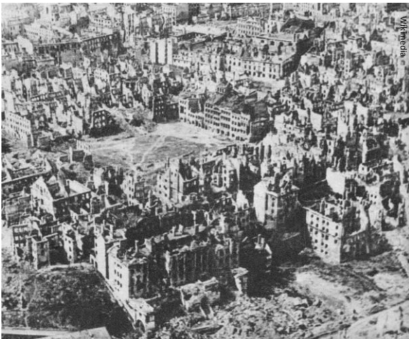
Aan het eind van de Tweede Wereldoorlog waren bijna alle gebouwen in Warschau vernietigd.

In de 20 e eeuw zijn twee oorlogen in dit werelddeel begonnen waarbij uiteindelijk landen in de hele wereld betrokken raakten.