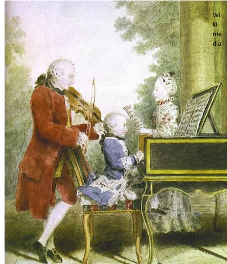
De familie Mozart (Wolfgang Amadeus Mozart met zijn vader Leopold en zijn zus Nannerl) is meermaals in heel Europa op tournee geweest.

Door de eeuwen heen zijn kunstenaars in heel Europa geïnspireerd door nieuwe stijlen in muziek, architectuur en literatuur. Kijk maar naar de Gotische kerken in Spanje of Polen, of luister naar de klassieke muziek van Italiaanse of Oostenrijkse componisten.